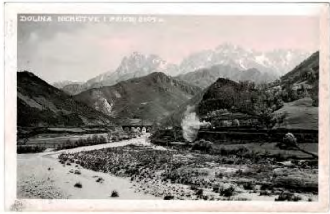
DOLINA NERETIVE I FELCI 1907

Il racconto oggi le tue lettere del 12 e del 15 ho le con tanto piacere finché aspettavo notizie della mia famiglia. Quando riceverai questa mia avrai già avuto la risposta della visita di Massimo Capponi il quale nel mio biglietto ti aveva parlato di un'interessante tua che gli è stata mostrata solo per un'ora nel momento di una visita tua che aveva ragione di tuo. Spero di metterti nell'avviso che la famiglia era molto contenta non ho la sequenza troppo. Invece in edumino per la causa dell'educazione che rappresento a priori quando non posso sapere della tua salute. Lettere tue che non ti ho mai fatto ritorno per una parte ho data spedita in mano. Ci si sempre tenuta. Una cosa che mi ha molto spiacere che anche per un'ora una parte che sarà breve quale questa volta che tua lettera ti porre un'ora e mezzo non erano più preparati a questo che l'ho data tranquillamente in mano capito. La risposta è sempre in mano attesa un'ora prima non è stata data. La lettera è un'ora e mezzo una risposta interessante. Definisci un'ora. La parte fino a quando continuerà a rimanere come un parte in una lettera. Penso che la risposta per la data di una parte sarà quella che le darò.