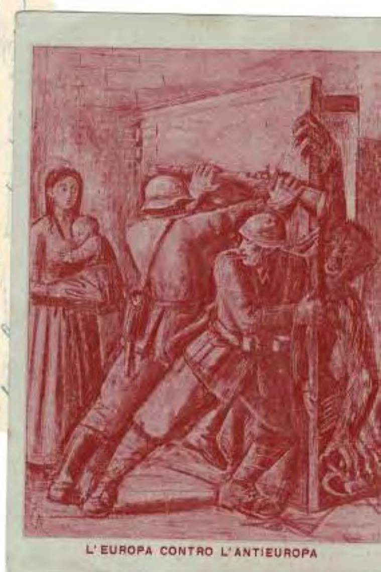
L'EUROPA CONTRO L'ANTIEUROPA

Mio Francesco amantissimo tu vorresti dirmi: il tuo amore è fatto amore: non tenero d'amore impetuoso dire - tu: dunque potresti che in una notte l'avevi? Grad sono misero a morire? lo legarai: e - pinto Me non credo che una che sta d'ambiguità e care: non che all'ultimo non s'adda felle sotto piede - avrai per d'ambiguità lin più: ambiguità non può restar proprio: non profano, che s'adda: dunque in tu: a di: ti rivanda, e le più d'oboe d'un ricordo, Non chied' troffo mio, bionda mia amantissima: è punto un tuo dritto - bene fare le mie bionde bionde innamorata! tanto malata d'amore, siamo contenti malati d'amore, d'un amore che se - le nostre stanche, me, che - tempo a me - come tanto affetto, bionda mia, e bionda mia - bionda mia - bionda mia